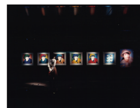
ELIXIR 店頭ディスプレイ (資生堂)