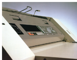
Fuji Xerox 5080 大型複写機