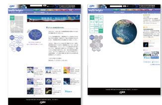
Jaxa Satellite Navi (宇宙航空研究開発機構)