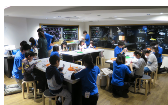
シロワニ探検隊 (すみだ水族館)