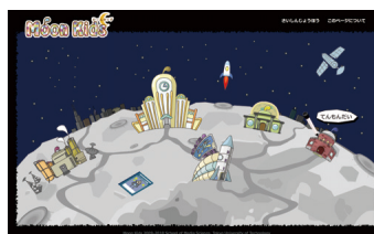
moonkids (月探査情報ステーション)