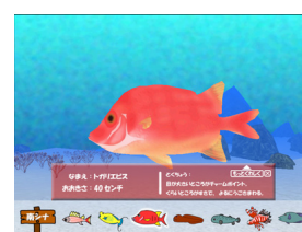
3D 水族館 aqua surf