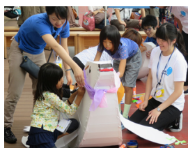
オットセイをつくろう (京都水族館)